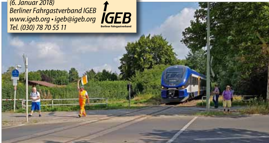
Zwei neue Haltepunkte sind geplant: Pankow Park am gleichnamigen Gewerbegebiet und am Wilhelmsruher Damm (im Bild mit dem Zug einer Sonderfahrt im Juli 2018) zur Erschließung von Rosenthal Nord und des Märkischen Viertels.