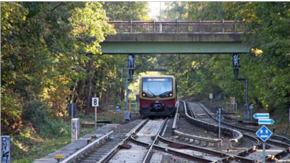
Für eine Durchbindung der Nordbahn hier an Frohnau vorbei scheint in absehbarer Zukunft kein Konsens möglich, aber einen zweigleisigen Ausbau der S1 bis Oranienburg planen Berlin und Brandenburg im Rahmen des i2030-Teilprojektes S-Bahn, über das wir in SIGNAL 1/2019 berichten werden.

Aber die Zeit drängt hier im besonderen Maße: Der Planfeststellungsbeschluss für den Regionalbahnhof Wilhelmsruh von 2011 wird 2021 verfallen, wenn die NEB nicht zuvor mit den Bauarbeiten beginnt. Dann müsste das ganze bürokratische Verfahren erneut eröffnet werden. Auch dieser Erkenntnis geschuldet hat der i2030-Lenkungskreis am 18. Juni 2018 das Teilprojekt als vorrangig deklariert.