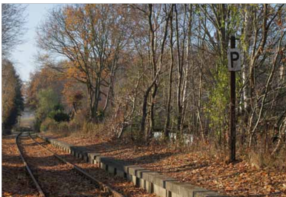
Einstiger Haltepunkt Schönwalde, künftig Schönwalde West. Alle Bahnsteige an der alten Heidekrautbahn sollen erneuert werden, was Neubauten gleichkommt.