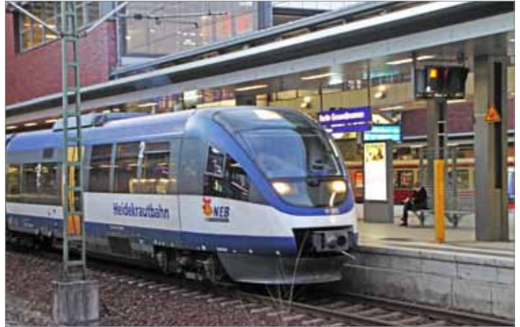
Viele Wege führen nach Berlin. Heute noch an Karow vorbei nach Gesundbrunnen, morgen vielleicht auch über die alte Stammstrecke der Heidekrautbahn bis Wilhelmsruh? Mit „nur“ rund 22 Mio Euro zählt dieses i2030-Projekt noch zu einem der kostengünstigen.

aus: verkehrspolitische Zeitschrift SIGNAL 5-6/2018 (6. Januar 2018) Berliner Fahrgastverband IGEB www.igeb.org • igeb@igeb.org Tel. (030) 78 70 55 11