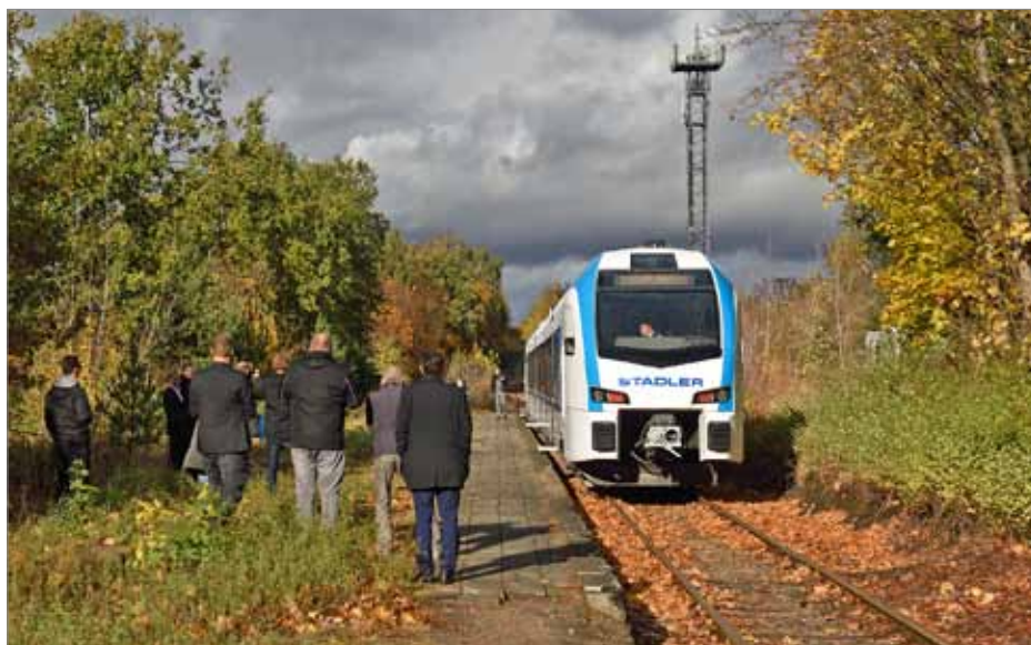
Die Stammstrecke der Heidekrautbahn wird regelmäßig vom Schienenfahrzeughersteller Stadler Pankow für Überführungsfahrten fabrikneuer Fahrzeuge genutzt, so wie hier im Oktober 2018 ein Akku-Flirt am Haltepunkt Schildow.