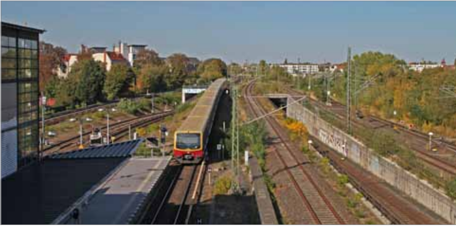
Hier neben dem S-Bahnhof Bornholmer Straße sind die niveaufreien Ausfädelungen von der Stettiner Bahn bereits seit dem Neubau des Nordkreuzes nach der Wiedervereinigung vorhanden. Künftig könnten hier die Züge zur Kremmener Bahn (RE 6) und zur Stammstrecke der Heidekrautbahn (RB 27) abzweigen. Die Züge der Nordbahn (RE 5) werden auch weiterhin den Umweg auf der Stettiner Bahn über Karower Kreuz und dem Berliner Güteraußenring nehmen müssen.