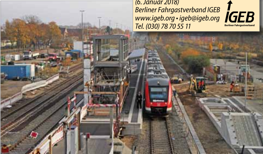
Der Bahnhof Velten wird zurzeit umfangreich umgebaut – aber noch ohne S-Bahn. Links ist die Fläche für einen späteren S-Bahnsteig freigehalten.