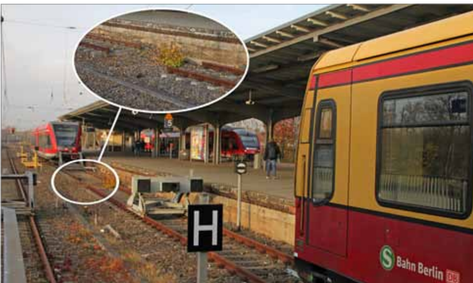
Bahnhof Hennigsdorf: Ein kurzes Stück fehlenden Gleises, das Velten trennt. Aber einfach nur verbinden und eine Stromschiene ans Gleis nach Velten reicht nicht aus. So muss der Abschnitt Schönholz—Tegel—Hennigsdorf zweigleisig ausgebaut werden, damit die S-Bahn ein stabiles leistungsfähiges Angebot zwischen Berlin und Velten fahren kann.