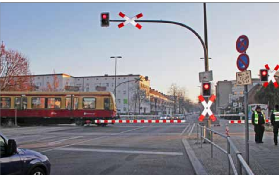
Der Bahnübergang Gorkistraße stellt eine besondere Herausforderung dar. Die Gleise zu überbrücken, wird mangels Platz schwer, eine Dammvariante der der Bahn könnte statische Probleme mit dem parallel laufenden Autobahn-Tunnel mit sich bringen.

BVG-Busverkehr, wenn die Schranken der Gorkistraße tagsüber länger geschlossen als geöffnet wären. Um das zu vermeiden, müssten die Gleise sowohl für Regio als auch S-Bahn vermutlich auf einen Damm gelegt werden, um für eine niveaufreie Kreuzung zu sorgen, da für eine Straßenbrücke beiderseits der Gleise der Platz fehlt. Mit der Beseitigung der Schranke würde außerdem eine verkehrliche Gefahrenquelle beseitigt. Aber ein solches Projekt würde einen mehrjährigen Planungsvorlauf und anschließend eine mehrjährige Unterbrechung der S25 erfordern und einen dreistelligen Millionenbetrag kosten.