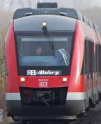
Berliner Fahrgastverband IGEB