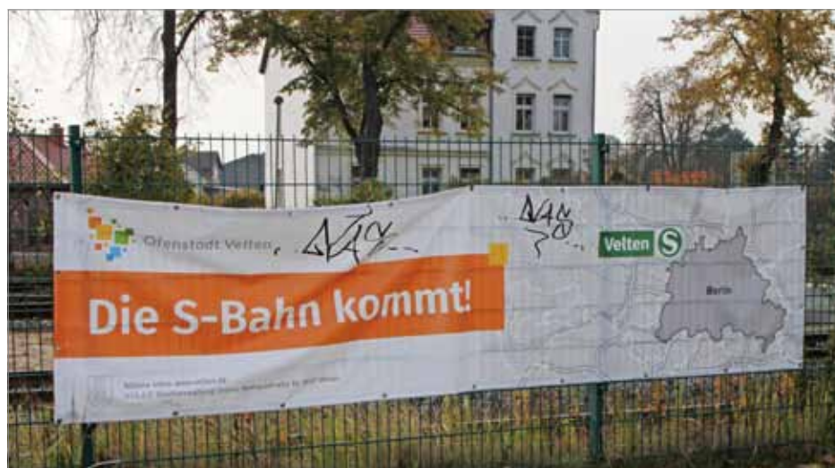
Die Hoffnung stirbt bekanntlich zuletzt. Eine Jahreszahl für die S-Bahn-Eröffnung ist auf dem Banner am Bahnhof Velten vorsorglich nicht angegeben.

Die Durchbindung des RE6 über die Kremmener Bahn parallel zur S25 bis nach Berlin Gesundbrunnen würde dank verkürzter Fahrzeit so manchem Prignitzer Pendler ermöglichen, morgens länger zu schlafen, insbesondere wenn die Durchbindung im Halbstundentakt erfolgen würde. Das würde aber den Verkehr in Tegel erheblich beeinträchtigen, insbesondere den