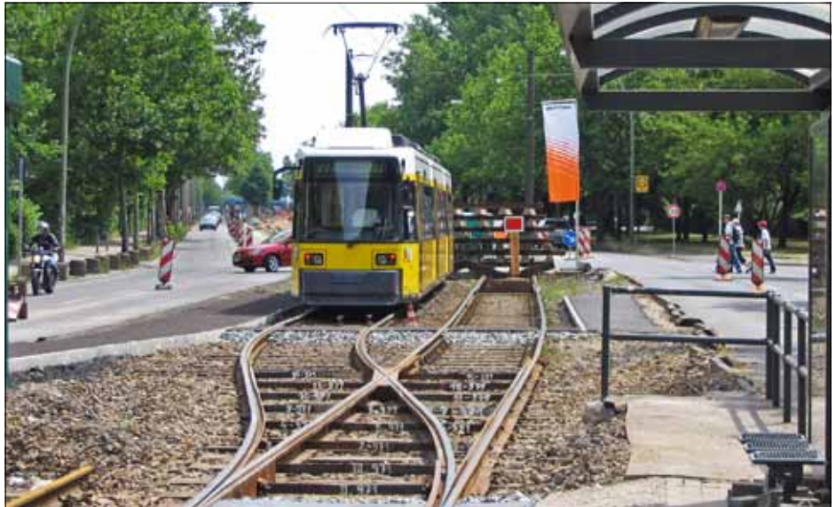
Niederflurfahrzeug der ersten Generation. Als Doppeltraktion mit 55 Metern Länge nutzen sie die Haltestellenlänge fast optimal aus. Die Zweirichtungsversion ermöglicht eine flexiblere Betriebsführung bei Baustellen und Störungen. Auch der Nachfolger der dritten Generation muss diese Mindestanforderung erfüllen.

Es ist gut, dass sich der Senat von Berlin und sein Verkehrsbetrieb schon so frühzeitig Gedanken um die neuen Fahrzeuge gemacht haben. Aber es war nicht früh genug. Die optimistische Prognose ging davon aus, dass noch 2016 die Ausschreibung erfolgt und 2018 oder 2019 die Prototypen zum Testen eintreffen. Dieser Zeitplan ist nicht mehr zu halten. Mit der Serienlieferung ist nun erst in