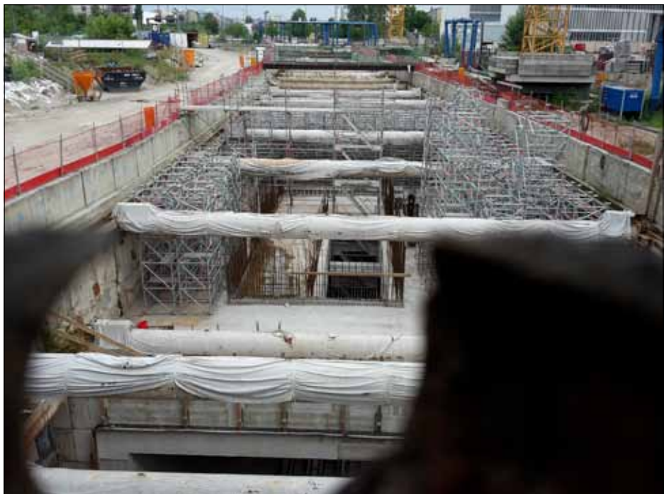
Blick durch ein Astloch im Bretterzaun auf den S21-Tunnel nördlich der Invalidenstraße. Hier ist die Tunneldecke bereits hergestellt. In diesem Bereich soll der provisorische kurze Tunnel-Bahnsteig entstehen. Fotos: Florian Müller, Juli 2016

muss, ist das nicht mehr Geld, als die Bahn am Ende für den provisorischen Tiefbahnhof am Hauptbahnhof ausgegeben haben wird. Und es ist ein geringer Betrag im Vergleich zu den über 100 Millionen Euro, die das Land Berlin für den Straßenbau zur Entwicklung des Quartiers an der Heidestraße aufwendet.