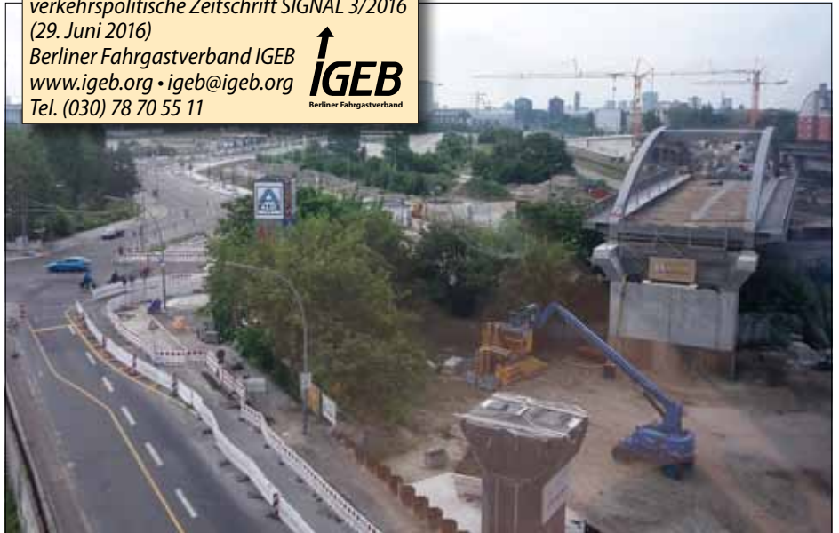
Die S21-Brücke über die Perleberger Straße ist bereits eingebaut. Daran schließt sich der Bereich für den geplanten S-Bahnhof Perleberger Brücke an. Für dieses Projekt soll 2016 nun endlich eine Kostenschätzung gemacht werden. Die erste!