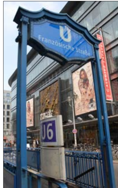
U-Bahnhof Französische Straße auf der U 6. Mit dem Bau der U 5 soll diese Station durch einen Umsteigebahnhof U 5/U 6 an der Kreuzung Unter den Linden/Friedrichstraße ersetzt werden.

Aus dem Erläuterungsbericht geht hervor, dass „zur Beschleunigung und Risikoverringerung die Unterbrechung des Zugverkehrs auf der U 6 zwischen den Bahnhöfen Friedrichstraße und Französische Straße für max. 9 Monate vorgesehen“ ist. Die Planungen der BVG gehen sogar von einer 12-monatigen Sperrung der U 6 aus. Für die täglich ca. 100 000 Fahrgäste der U 6 dürfte diese lange Sperrung mit Reisezeitverlängerungen von bis zu 30 Minuten verbunden sein, da der beschriebene Ersatzverkehr durch die zu erwartenden Staus im Straßenverkehr einen kaum akzeptablen